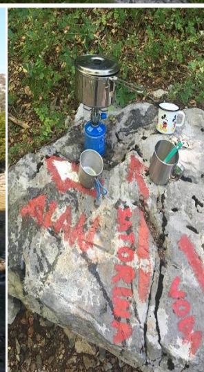
Fotografije sudionika ture 2020.