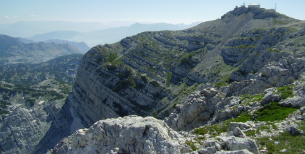
Najviši vrh Čvrtnice, Pločno, s vojnim objektom. U pozadini (istok) vidi se vrhovi Prenja od kojih je najviši Zelena glava (2115 m)

o kojemu skrbi Planinarsko smučarsko društvo »Vilinac« iz Jablanice. Tu je i uređeni izvor vode, što je svakome planinaru korisno znati.