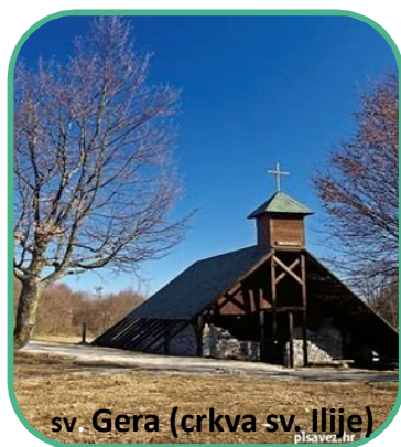
sv. Gera (crkva sv. Ilije)

Sošice (565 mnv) - sv. Gera(1178 mnv) - Bezimeni vrh (1006mnv) - Ravna gora(1001 mnv) - Pliješ (977 mnv) - pl. kuća Vodice (850 mnv) - Sošice